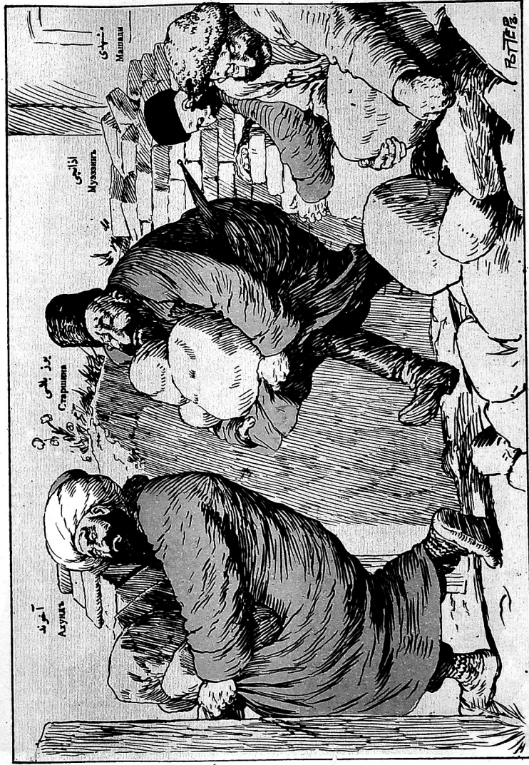
سرپ سکنده مکب دتلاری آلودب اوزله ابو تیکر. Уасть мекансго стронснсаго матераса (Српсб, Елска, 196)