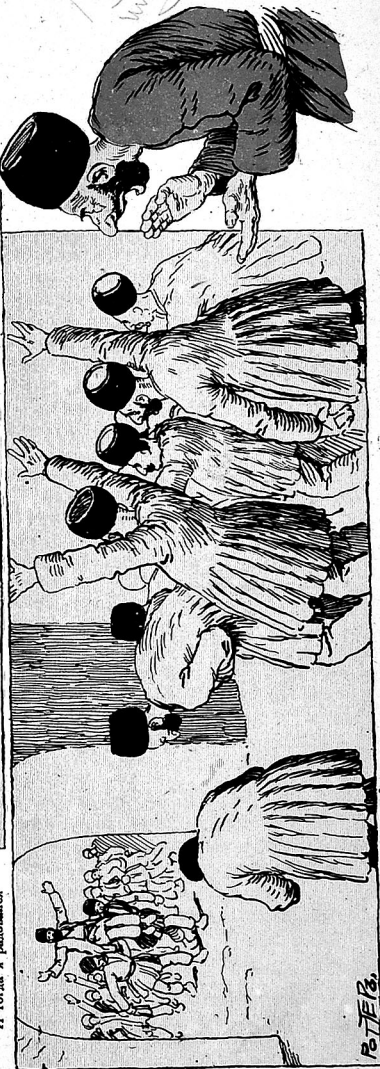
И сейчас ралучи.