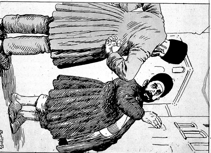
—Манали Джедфаръ, куня та неман? —Куня та неман, хулу помангиларъ съ дерестордкъ —Манали Джедфаръ, куня та неман? —Куня та неман, хулу помангиларъ съ дерестордкъ