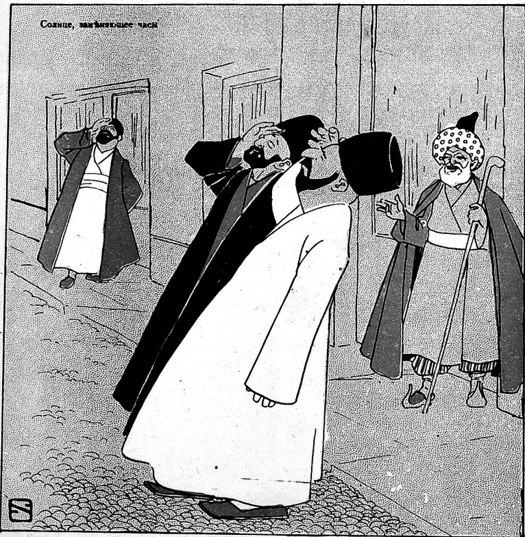
Солнце, заходящее часъ

№ 2. ۲۲ قيسی ۱۲ قېک. Цѣна 12 к. МОЛЛА НАСРЕДИНЪ