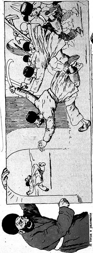
دورت ایل اقل مچهد عامی تیردا حسن آغالی تیریزدن قورولده.