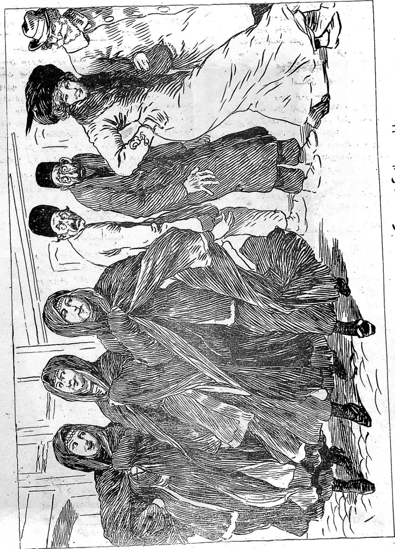
ارلری بیر یانه گیننده: نه کوزلر