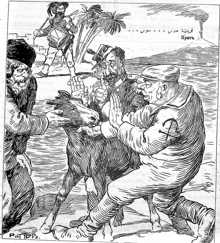
(ملائقہ لکین جیوانی اولکدوس)