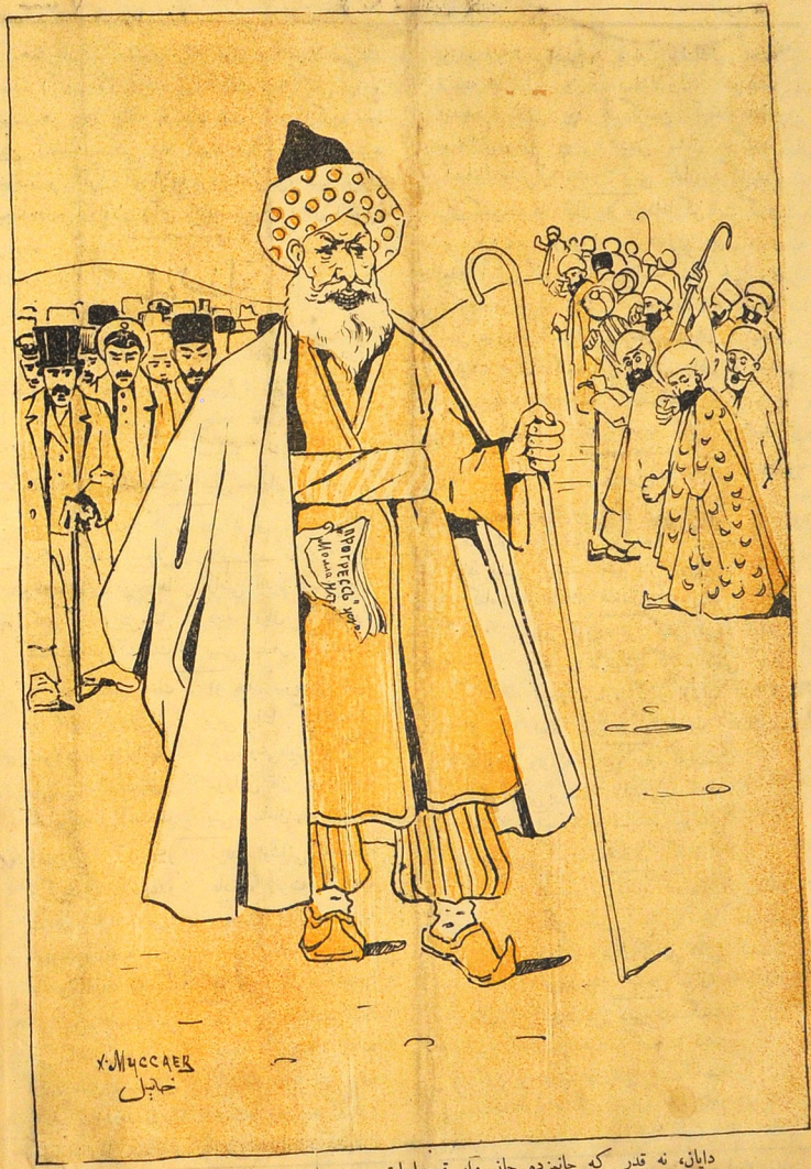
دایان، نه قدر که جانزده جان وار قویسایلیق سن جماعتیزی یولدان چخارداسان.