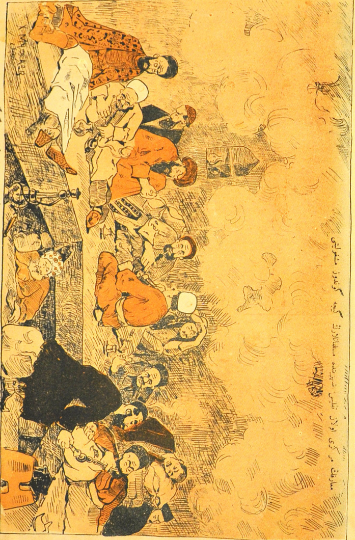
مبارک مر کچی اولان تقیسی شریعتیہ مستطالارک کیمہ کریدرز مشیرتی

اوز بو تک اوز ک بوئین ویر سکا بو پده کر که لکه آخردہ مقام سکف کھان اولد