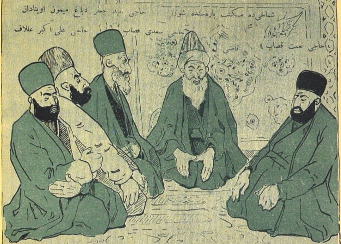
قاسمی - مکتب لازمہ یا یوحنا؟ خیر آغا لازمہ دگل دگل دگل بیڑ طہران - کوچہ چنبدہ / جہنی اوز المزیلہ سائین آلا یادریک