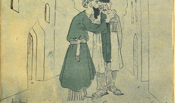
الہم تم کیمز تم عرب تم... (ہوف) گوت، آرخاین اول بو دعا جوق معجزہ در گوزارک بر ساعتک اینجده باخشی اولاماندیم