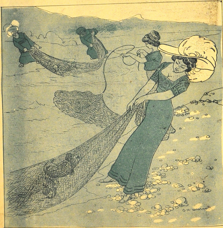
ای حیوان بی زبانلار، هیچ دارتمیک، سیزک انکر ازلدن بزه قست ایش، بزه الله سیزی روزی خلق ایدوبدر.