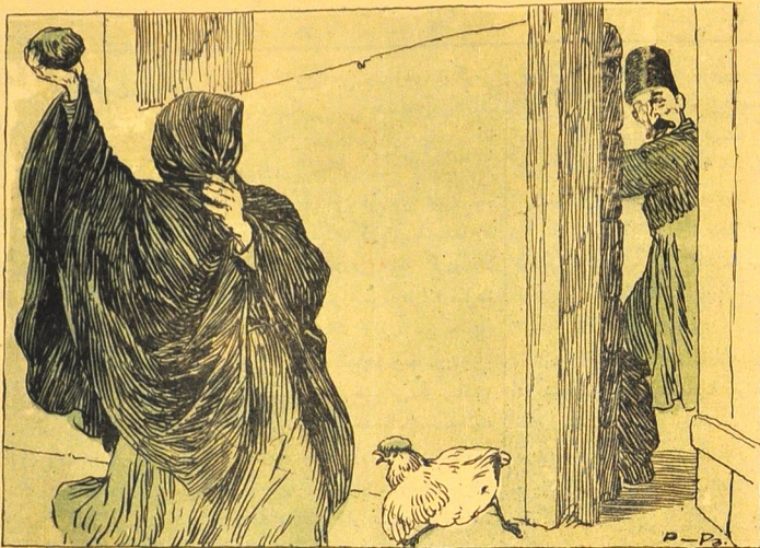
باچی، کرلای حیدر عمو اوغلی ایوده در؟ کوک اوغلی گورمیرسن نامرحم وار؟ ...