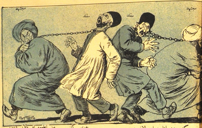
بوری کل من اعلم، او یلان دیور. بوری کل من اعلم، او یلان دیور.