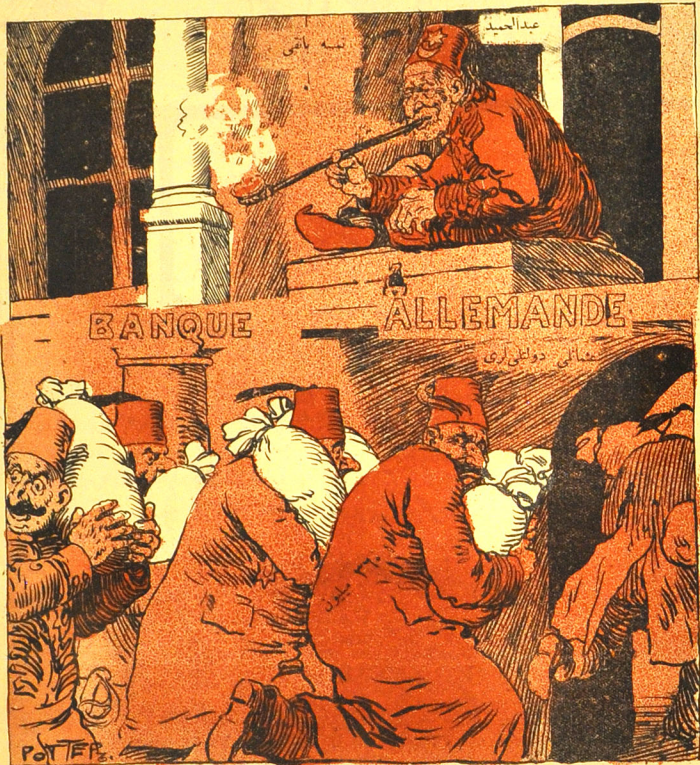
بوپوک نہ توکرہ کچیک اونی ہنار

№ 12 12 К. МОЛЛА НАСРЕДИНЪ 12 قیسى ۱۲ قک