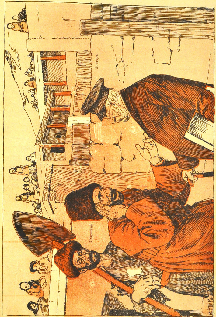
بو کدوہ ناخوش وارمی معاجہ ایہیم؟ غلادو آقا ساغ اولسون شکر اللہ آزارلی زاد بوغدی