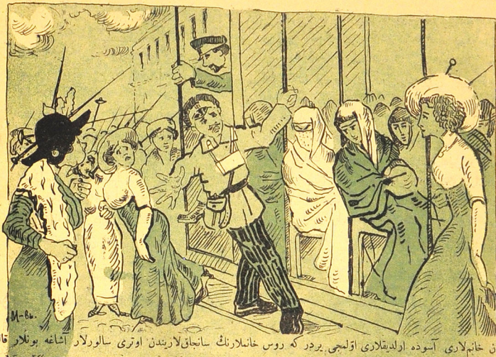
مسلمان خانملاری آسوده اولدیقلاری اولمجه بردر که روس خانملارنک سانجاق لاریندن اوتری سالورلار اشافه بونلار قالور.