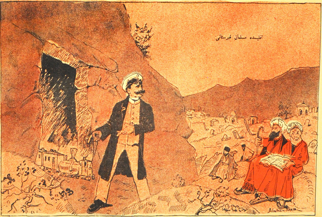
ئۆلە كۆدە گىرك بىر ايتروشتالارىسى سىزىك قىرستاندان كىچىروم.