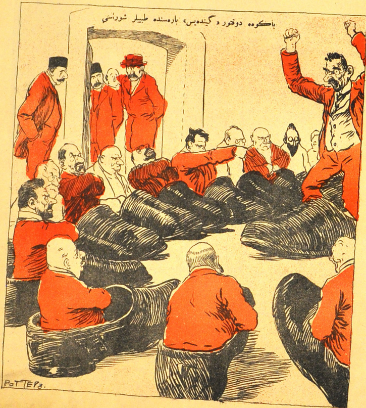
باسکوهه دوختور د کینه‌یس، باره‌سنده طیبیل شوراسی

№19. ЦѢНА 12 К. МОЛЛА НАСРЕДДИНЪ نمبره ۱۹ قیمتى ۱۲ تیک