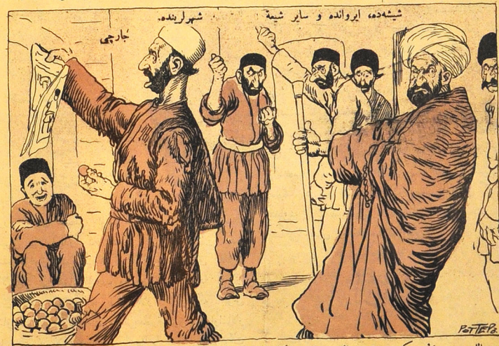
ی انشی سون! هرکس ملا نصرالدینی اوخویا کافر، مرتد، ولدالزنادر، اوشخص ایله رطوبت ایله ملاقات ایشک اولماز.