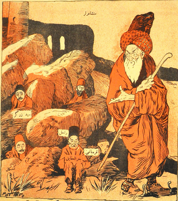
یوخ ایله د کل شاعرک آتین آدی قالدی