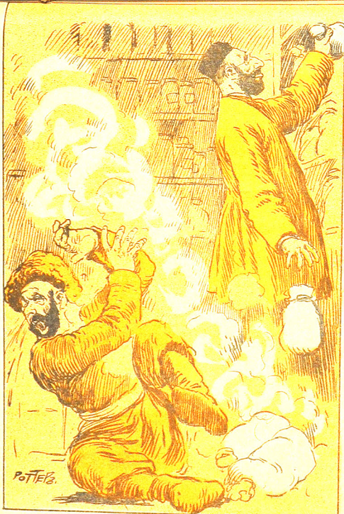
جیبع دردلرک درمانی بو تورمالارک ایچیندهدر.