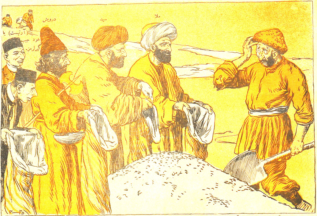
اکیچی — بار پرورد گارا! بو ملا، سید و درویشلر همیشه کیلیدی، بیس بو آدواده اوختارینی قرختلار کیملر؟