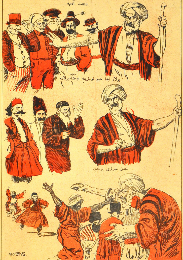
اوخ... اصل منیم نوره ایله سیز سزگه ۷۵۰۰ ایل قاتقدان نه قوروب کیشتم ایله ده فالوسکزه، هیچ د کشلیمویسکزه.