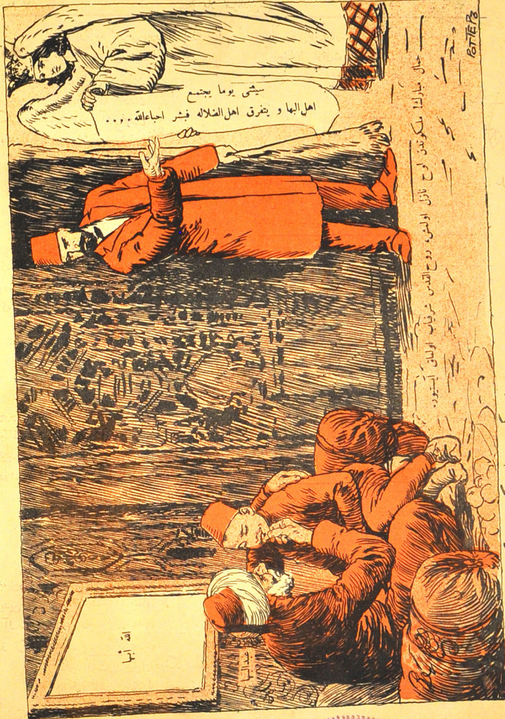
مولا تصیر قندقل!