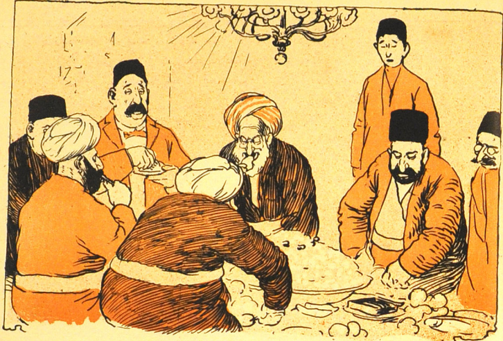
دولتی ایرنده افطار