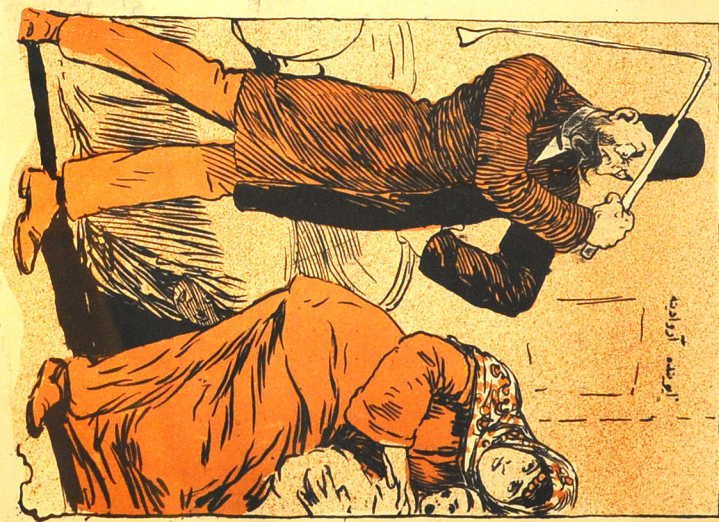
گریه و تنی بر نامت گریه کن سیدامام