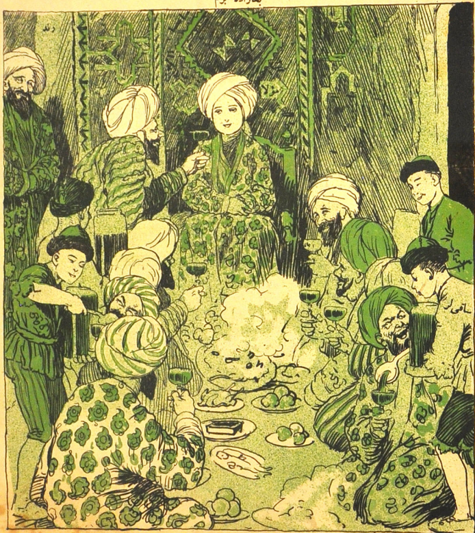
بای بچه خرسند قبل!