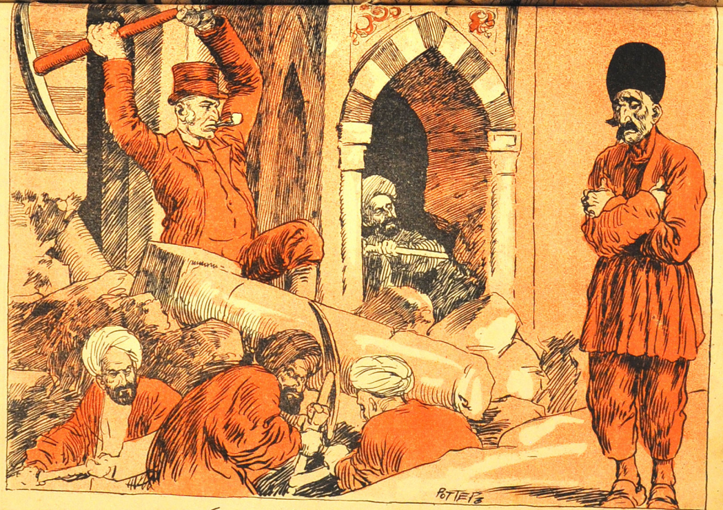
پوم نوبت میزند در طارم افراسیاب برده داری میکنند در هر قصر شکوت