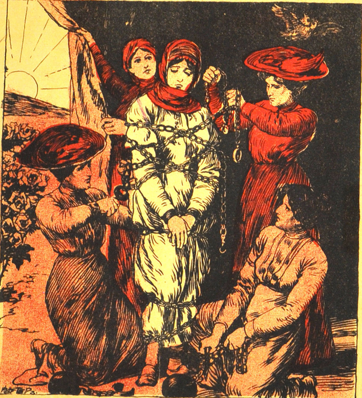
سیزه کومک اولسون ای مهربان مسلمان خانملاری چاشنگ من بیچاره و بدبخت بایسکی بیده بلکه آزاد ایدمگه