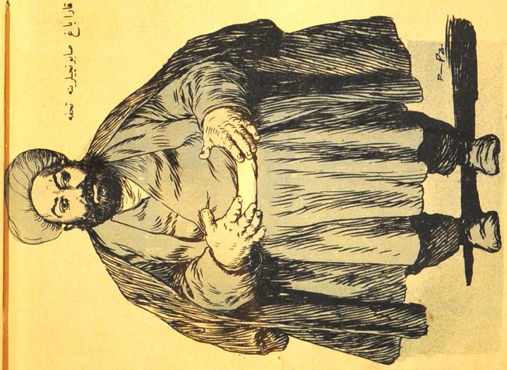
شینلندیکجه ملت بو کرکلی پئی ایچی نییورت بو حده گلی