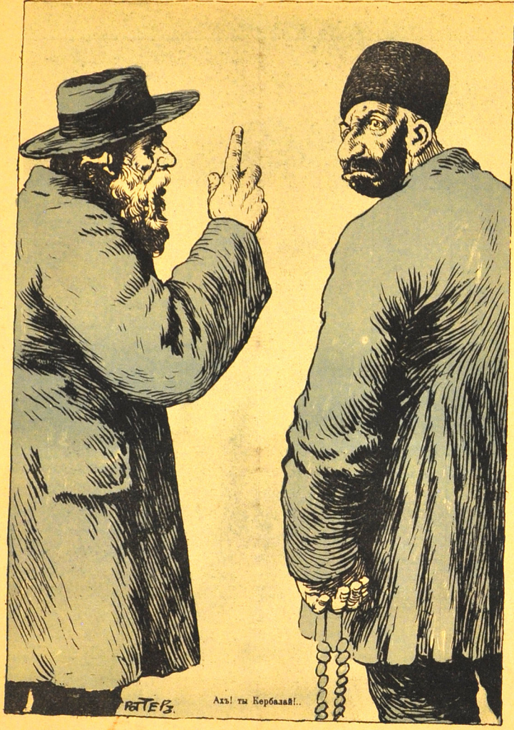
هر نه جور سوکسم اوره کیم سورویایان، آختی کربلایی، سن نه وعده آدام اولاجاقان؟