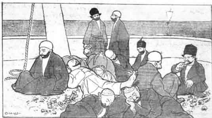
غرادانه کپین باک مسافره.