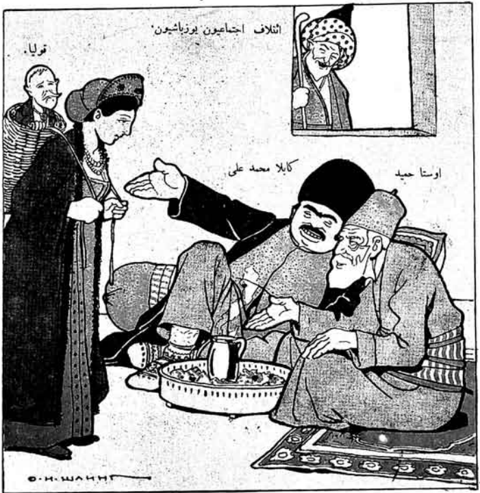
..... بويور، بويور قوناغمز اول، يىلى بوزباشدى.

№ ۶ ۲۵ قېك. قېنى ساتېجى الله ۲۵ قېك. موللا ناسر زدين ۲۵ قېك. ۲۵ قېك.