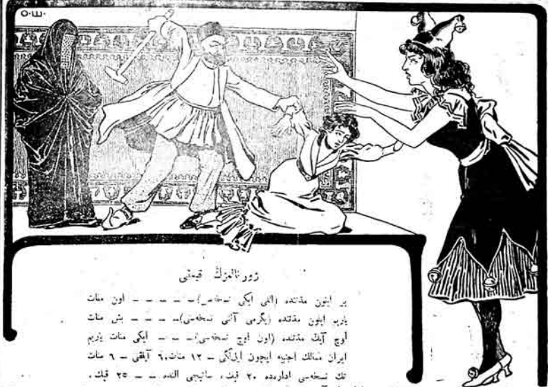
زور ناگزینک قیامتی

بر ایون مکتبه ایلی اکی نسیخه... اون مات یارب ایون مکتبه زگری آتی نسیخه... بنی مات لوج آیلک مکتبه (اون اوج نسیخه)... ایکی مات یزیم ایران شاکل اجنبی ایچون اوزگن - ۱۲ مات، ۶۰ آقی - ۶ مات تک نسیخه ادارهده ۲۰ قبت، سانیچی نسیخه - ۲۵ قبت.