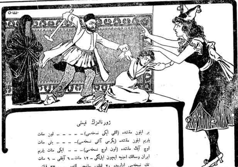
زور نالورگ قیتمی

بر ایلون مقدمته (الی ایکی نسخه) - - - - - اون مات یازم ایلون مقدمته (یکری آتی نسخه) - - - - - پیش مات اوج آتک مقدمته (اون اوج نسخه) - - - - - ایکی مات یازم ایران وصالک اجنبی لیبون ایملکی ۱۲ - مات ۶ - آتیکی ۶ - مات تک نسخه ادارده ۲۰ - قک، ساتیسی الهه - - ۲۵ - قک