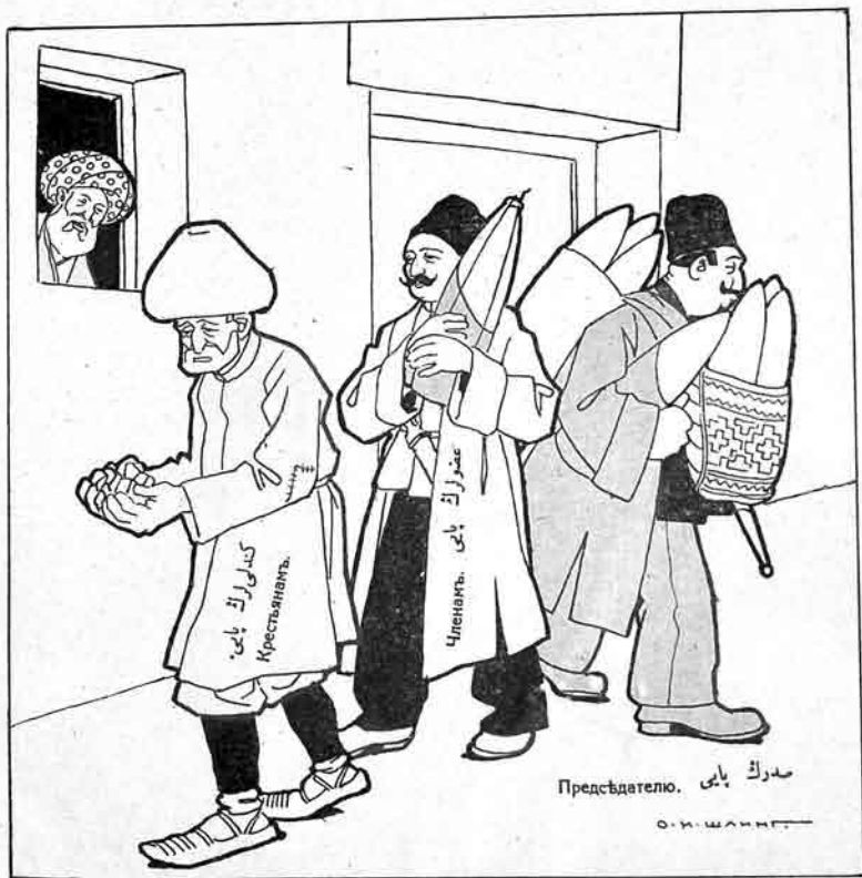
تەد بولگىسى * (въ провинціи) кооперативнаго сахара Раздача

№۱۲ Цѣна 25к. МОЛЛА НАСРЪ ЭДИНЪ. قیمتى ساتىجى انده ۲۵ قېك.