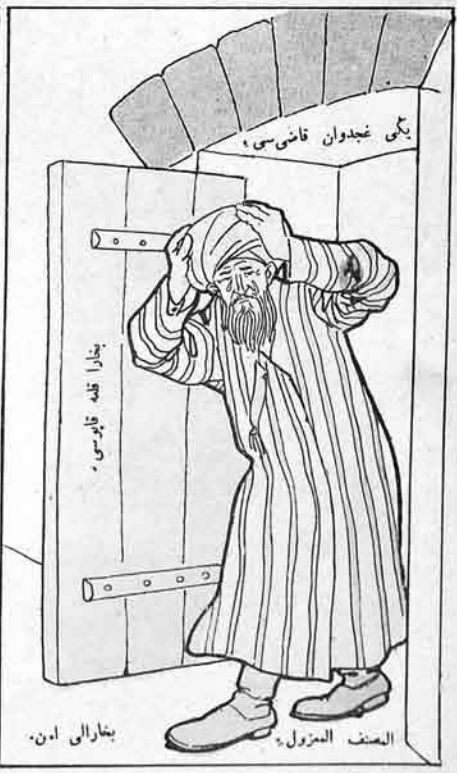
واخ، باشه گنلر نہایتی بخارادان قورغولدم، یازیق حاله.