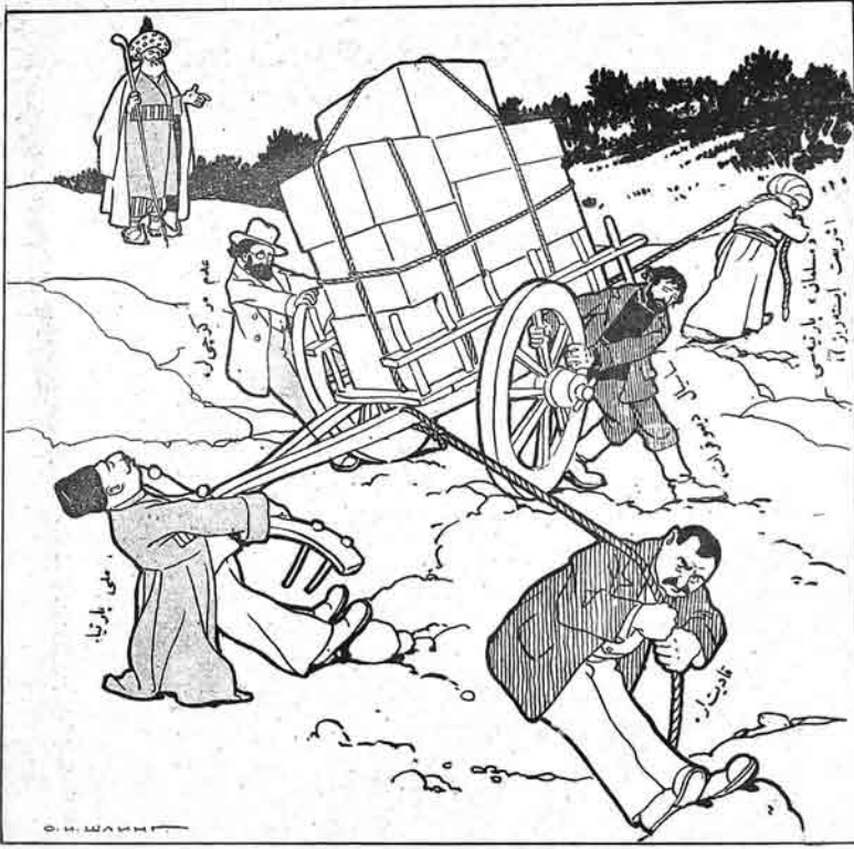
مجلس مؤسسان انتخابى و سلساز پارتىلارى:

تېتى ساتىچى اندە ۵۰ تېك. موللا ناسرۇ زددىن ۵۱. ۲۱ № ۵۰ك. ۵۰ك. ۵۰ك.