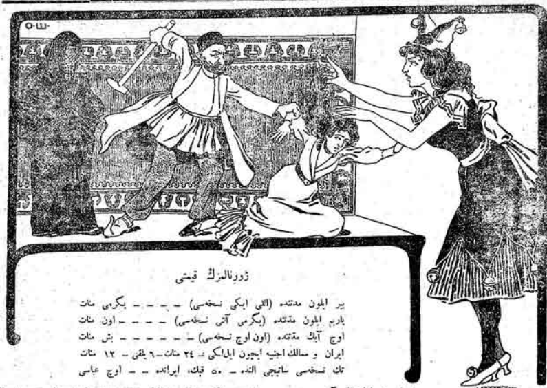
ژورنال مزک قیسی

غیر شعراره هر بیر کابدن اون نسخه دن انکیک گوندیریلیسر. خواهش ایدیر قیاقجه تاماً پولنی گوندیریلی درنسر.