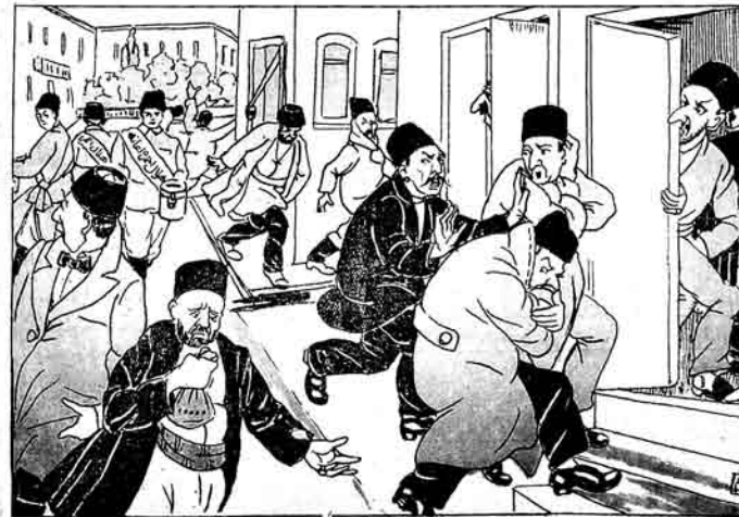
آناطولسی حربدهارنه اعانه نوبلایانده