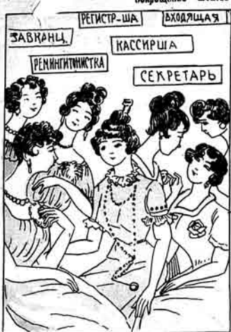
Хизматке قالانلار . Осташился