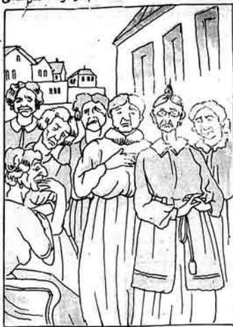
چهار برانلار . Сокращенный