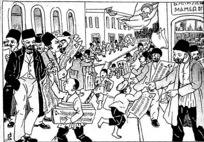
تورگر يونانلاری ازنده