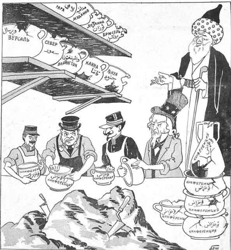
— نه قدر بو، قونفرانسلدن، قابر سه کن برشی چفهاز، چونکه با هیق مکر با قتی دکل!.....

№ 8 Цена 2 мил.р. MOLLA-NƏSRƏDDİN ۸ قیتی ساتجی النده ۲ میلیونمان