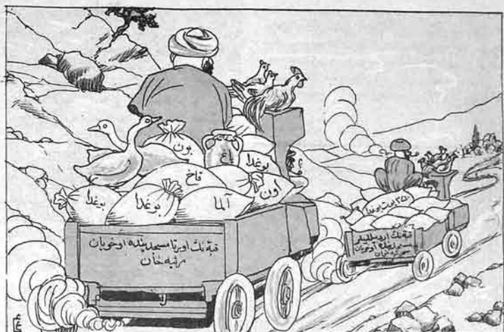
— باکو میٹھا خوالاری محرم آیینک، اریطاق دیرگیسینی، ۱۰۰۰۰ قانص حیح ایدرب قبه دن باکو به قایلیدر لر .