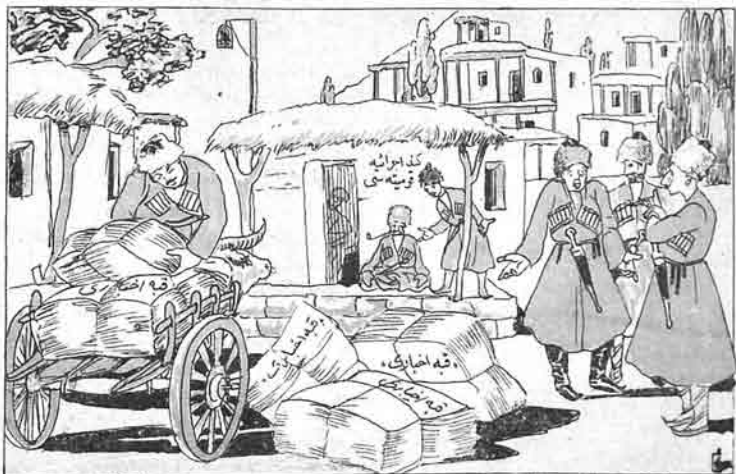
(قبة کنه لریده)