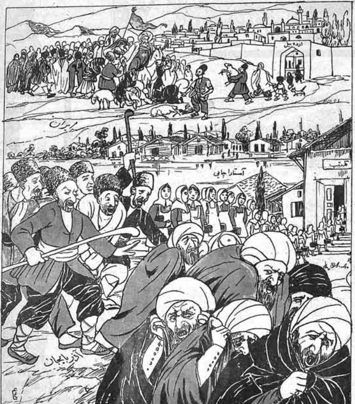
— چاکن او بیری طرفده آغامیرزا علی اکبر آغانکند دعا سنک برکندن ایرانلی قارداشلار بهشت بولی دو تو بلار . بو طرفده ایه آذربایجانیلار چشم بولی دو تو بلار .

№ 16 Цена 5 мил. р. MOLLA-NƏSRƏDDIN ۱۶۹ قینتی ساتیجی الینده ۵۰ میلیون مانات