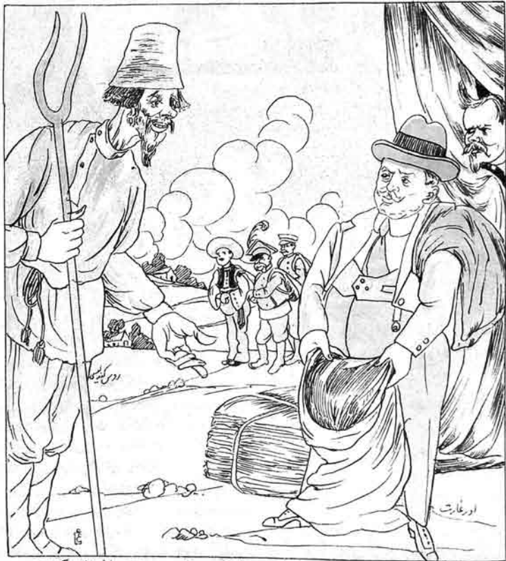
نورغارت - من ستر ميليارد قزىل پول ايستيجكديم، اما گوريزم كاسب سن اوچ ميليارددان كيجرم يفتى دولدور بو جووالاره. كئلى - الله آتسا رحمت ايله سين خرمان واكتير بوش چوواله احتياجلقمز وارايدى، اولى ده كتير و بسز آله بركت ورسين:

№25 Цена 15 к р. MOLLA - NƏSRƏDDIN نمر و 25 تک نسخه سی ۱۰ ملیون