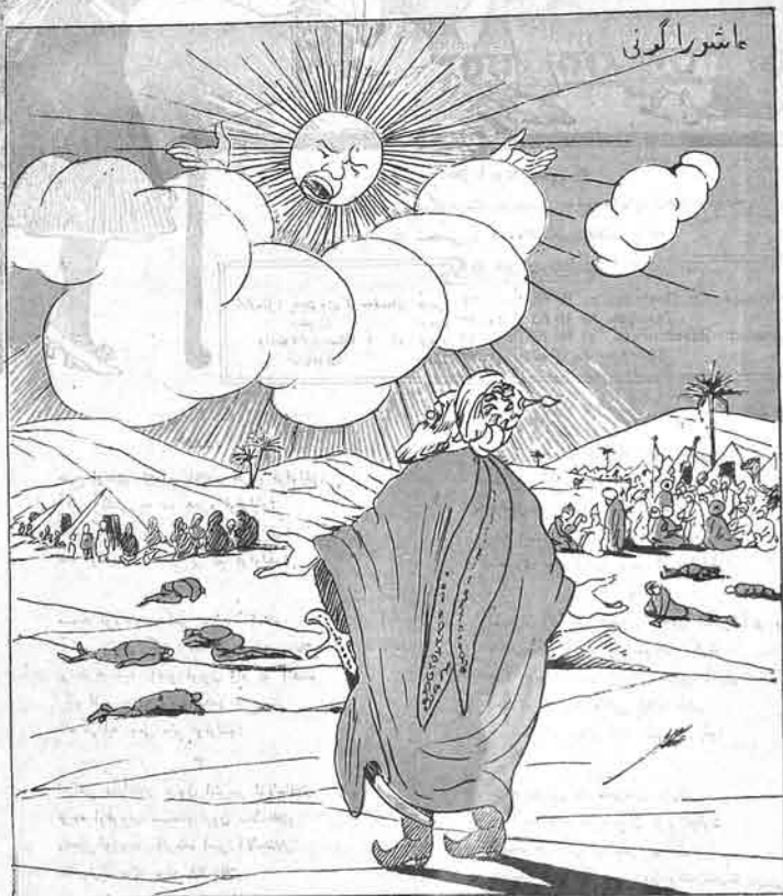
عمر سعد - گوئشه: بالام نه ایجون باهیرسان! گوئش - مجلسی امر ویزوب که: بوگون مرگه چون یتیش ایکی ساعت اولسین!