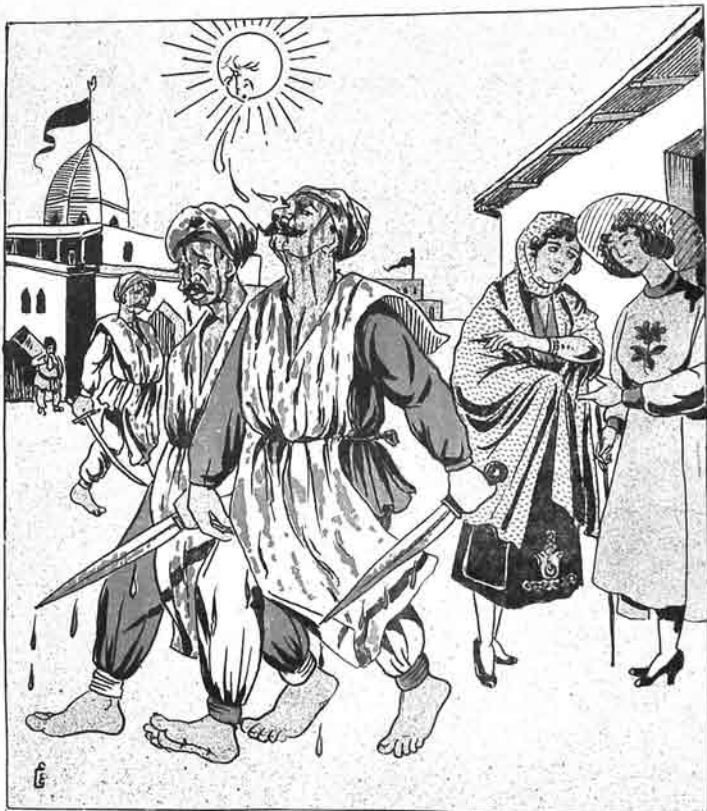
— آي قيز، آي قيز! بو كيشي لوده باشيني يارو بئدي، گورنه گويچك كيشي دي. — يوخ، يوخ! بونلار اينديجه انگليز لري كريلادن تاووب تايمدوب گلر لر.

№31 Цена 500,000 р.ЗАН MOLLA - NƏSRƏDDIN ۵۰ میلیون قیمتى ساتقې الذره