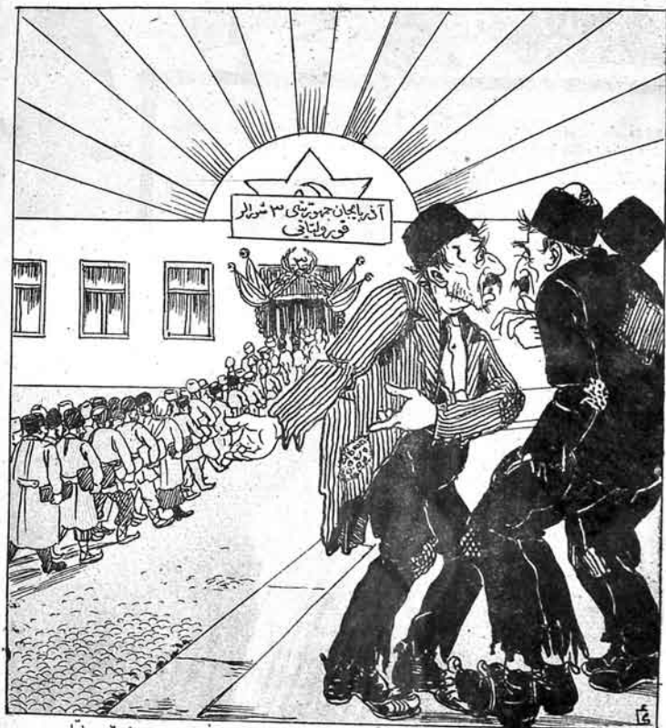
کهنه بورژوازلار - اده اییدی کس! پیله که بولار باشلیوب ۳۰ نجی قورولتای نه درکه لاپ ۳۰ نجی قورولتایلا اولاجقدر.