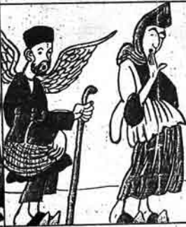
کوز مرسل اینش حوری ملا پیدنالی