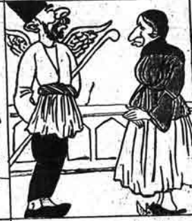
ملاهنای سالتش معدی حسینی جاندان