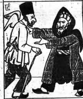
دللاک سفر بککش ملا غلام رحانی