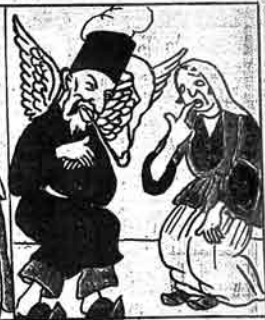
ملا زیدمه ایله دوشش سامانچی رحمان