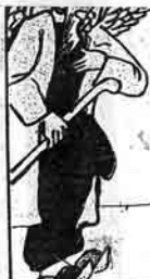
سر ملا مامبرنی آلتش لاهیجلی شوک