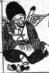
ملا ملک سانی آلتش قاطر سلیمان