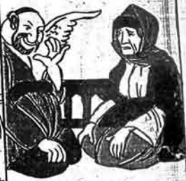
اگیشمه ملا لاطمه پتقال کریمی غلمان

اینگلیزجه دوشونجه تورکجه دوشونجه عربیجه دوشونجه فارسیجه دوشونجه عجمیجه دوشونجه عربیجه دوشونجه تورکجه دوشونجه اینگلیزجه دوشونجه