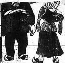
چتبه ملا اصاف زیری غلامه عورت