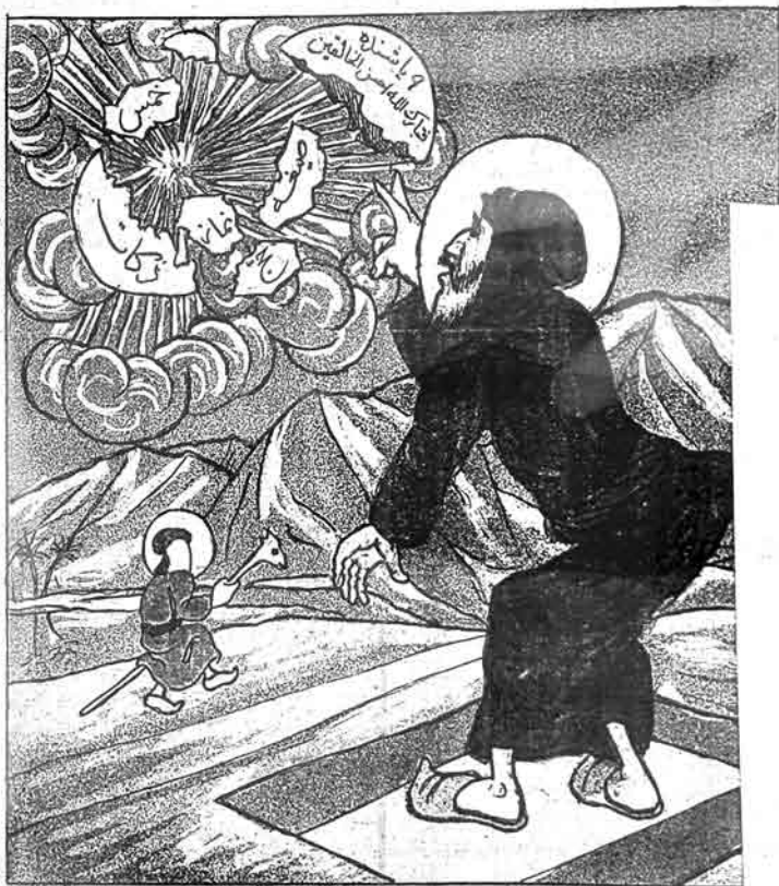
شق القمردن چيقان تاريخي پارچالار.

№ 14 Цена 20 коп. MOLLA-NƏSRƏDDIN قېك ۲۰ قېتى ساتيجى ايلده