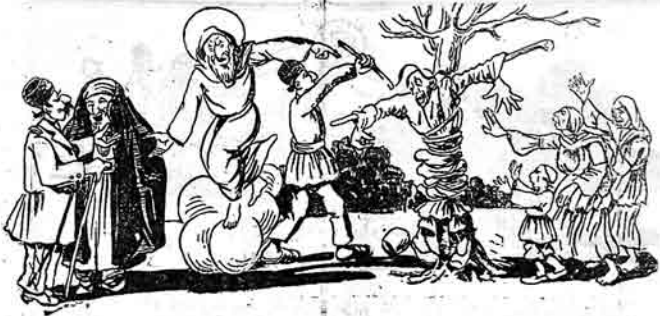
اللہ - بالوار خان سنی باغلاسن' یوقا گناکدن کچہرم

کچیر او بری اوتناغ. اونگ قاباغیا چای قیان و خوراک گیدیر.