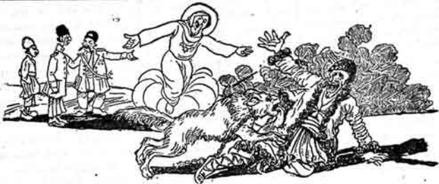
الله- ای منیم عاصی بندم بویو کلرک یوزنه عاق اولماق منیم شریتمده یوقدر