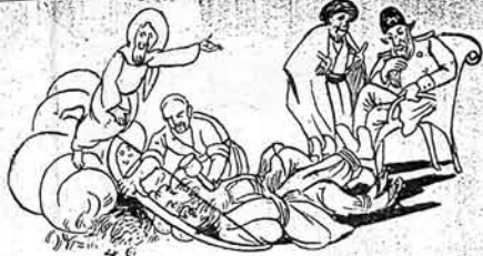
الله - صبر ايديك! من بو دنياده نوز ظالم بندرلمه ميدان ويرمشم

توقماقلاری ایله یانینا دعوت ایدوب اطراف کئدرده اولان خانلار بدهاقوناق چاغیردی حاجی خان صحتک شرین برنده امر ایلدی که طوله دن کئدیلمی کتیروب بره یقده یلار سو گرا پامیوق آتانلارا امر ایلدی که کئدیلمک ساققالارینی سال سینلار یای توقماغک آتینا پامیوق کبی آتینلار بر آدان سو گرا کئدیلمک توکبری یای توقماغک آتیندا داریتوب چیتاریلدی ساققال یلاریندان قان توکولمگه باشلادی کئدیلمر غش ایدندن سو گرا یه آپادوب طوله به سالدیلار صباح خان اولاری یانینا کتیروب دیدی هر گاه کیدوب برده ساققالارینی او زانسالار یه کتیروب بو جزانی ویره چکدر