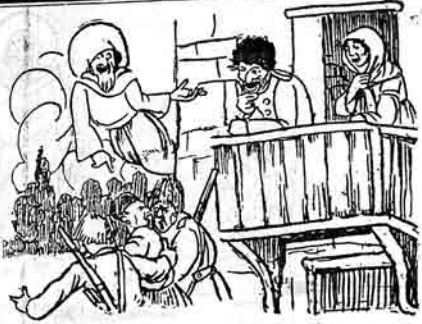
الله ای اوغلان قیزک کابنی منیم شرمتمله کیلوبدر داهای قیز نامحرمدر باخسان سنی جهنم اویدینا یاندیراجانام

عالی دارالمعلمین و نمونه مکتبیری طرفندن اوقتایر اقلانی مناسبتیه تورک تبلیغ تقیدیت تیاتر سوندا ویرش نمانشاده فای آفریندا دورانلارک توز فوهمو فار دانشلاری ایجری. بوراقلماسینگ اصلی یوقدر.