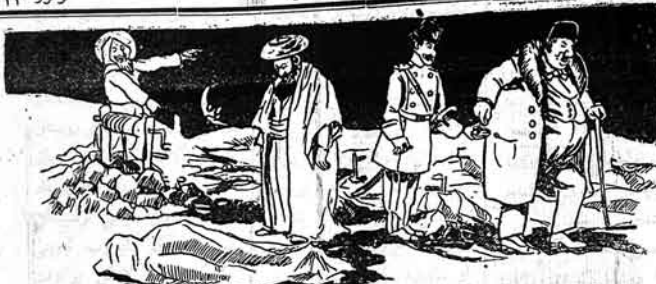
الله ای بنده! سنگ کناهارسکی باشلادیم ایندی بهت سنگ بریکدر!