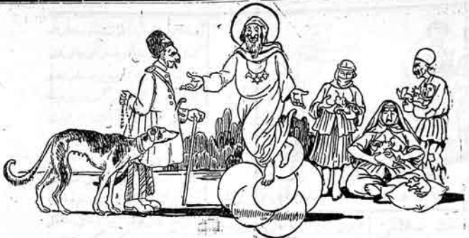
الله - بن شرمتمده قول نوز آفانك اطاعتده اولمايدر