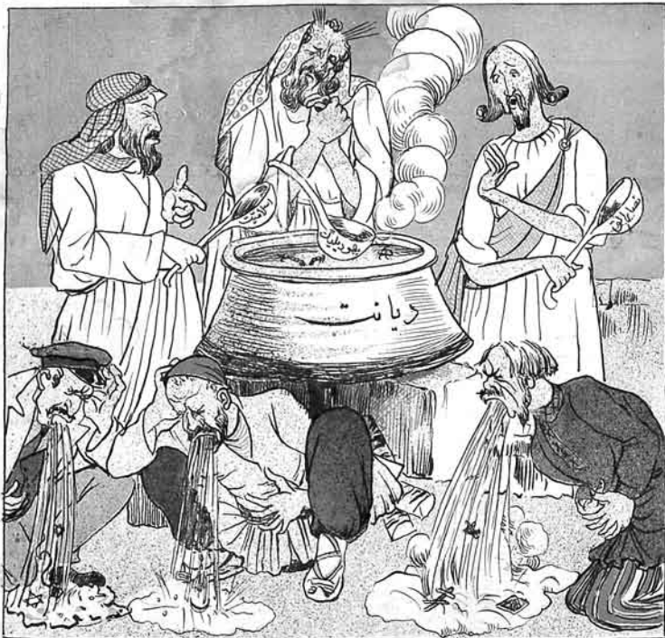
داما انسانلار بو کییی قوخومش یسکاردن نقرت ایدوب مئهلری بوجور یسکری قبول ایتبور Daha insanlar by qibi koxomya jemoqlardan nifrat edib, mo'dolari by cur jemoqlari kabyl etmir

И. Ф. АХУНДОВ замяе Азәрбајҹан Рәсүмүдәдә Ҷәмһүр Кутубханәсә Инд. № 2521