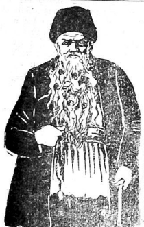
هر گاه شیخ دیین دوغرو اولوتسا عالی معاده شیم ساقاقدان حویور و ملکشار سالانلیرلار.

کینین قالدی من غرورنه ساکی کربلای علی غل همته کیدیمر پیترووسکجه کیشیش کتیرسکه، هرک کینینی وارسا آباروب پیترووسکجه ملا ابوظله کیدوب کتیریم کله؛ اما لنت اولون غرورنی واری. اما بتایه دوتنک بوز یشیتی یازدی. اما کور کوتورده اون دوت باشینا بر قیزه تولندی. لکن ایسته منه شتی منامعت وریمسن. کینینله ییله آدانا کسدری کله؛ اکوب دغدیفلاری حرامزاده اولماجدور.