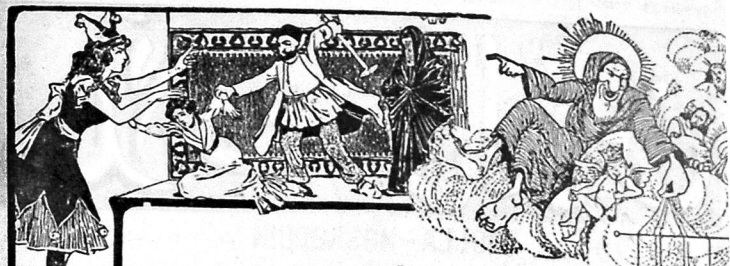
آیوه ایمتلی: گوردک شہرہ گوردک شرطیہ ایہ... ۱۹۰۰ء تک ۲۰۰۰ تنی آہی جنات ۴۰۰۰ پیکی امانت ۱۰۰۰ ہوت. مدن اشچی و ملکار ایچون ۱۵ لیک آون ایچی فاجانان آلیور تک سئس ہر روز ۲۰۰۰ لیک

عنوان: ادارہ و فائورمز تاروی بوجوی او نومرو ۱۶۴ نغز، نومرو ۴۰۳ Адрес Редакци и конторы: Старо-почтовая д. № 64. тел. № 40-83.