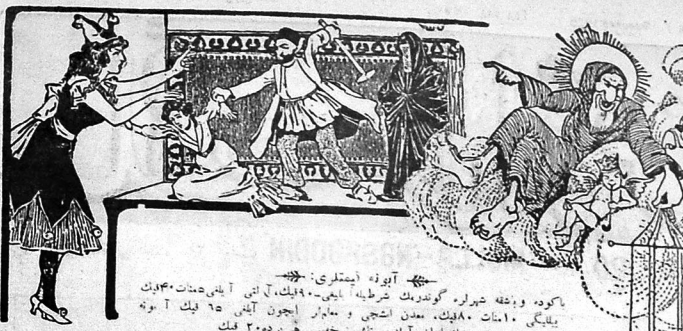
«آيوزه ايشقلى» كودە ۋەتەن خىرلار گوندەك قىرغاققا، ۱۹۹۰-يىلى، ۱-ئىيۇن، ۴۰-بېكەت يىلىكى ۱۰، ۸۰-بېكەت. مەدەنىيەت ۋە مائارىپ ئىچۈن ئاينى ۶۵ بېكەت آتۇپ ۋەقە قاتلامدا تۈرۈك تىلىغا ۲۰۰۰ بېكەت خىتاب: ئادەم ۋە قاتلامدا تۈرۈك تىلىغا ۶۴ تۈرۈك تىلىغا ۴۰-۸۳ عنوان: اداره و قاتلامدا تۈرۈك تىلىغا ۶۴ تۈرۈك تىلىغا ۴۰-۸۳ Адрес Редакции и конторы: Старо-почтовая д. № 64, тел. № 40-83.