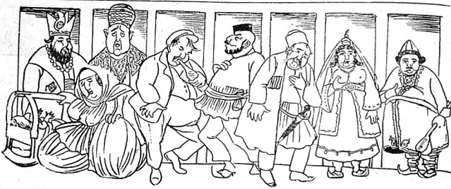
دۆلىتى تۈرك تىلىنى سۆزىدىدا ياقىتلىرىدا گۈزەلەن ئىختىصار باش دوستا، ئىختىصار لايىھىسى دۆزەلدەنىڭ ئۇزى بۇ روللاردا چىقمايدەر.

بىر قىرغاق جەنۇب قىتتى لوندوندا داشىۋرلار. بىر قىرغاق شىمال قىتتى ئامېرىقا ئادامىلىق ئىستەيدۇرلەر. شادە پارىژدا ئوتتورۇپ كىيىن ۋەتەندىن قاتلان جۇھارلارى قاقەنىڭ ال چاتماستىنا داشىۋر بىر قىرغاق ئىچىرىدە مەھارەلەر كىيىن. پارلمان غەشۋىلەردە ھەرقىر قاتلامنى چىكۇب دىيىر آغا حىقىقت خىل خوش غەشۋىر ۋە خوشبۇت تىباكو استە. بىر قىرغاق ئىتتى استقلال بايراملارنى ئىزدە. رەسىم ئىستقبال دۆزەلدە. ھەچ يىلمىرىك كە: ھانىسى دۇغۇرۇر. اما ھەر نە اولۇرسا اولۇسۇن استقلال ئىلە بىر قۇرى آدىدا اولسا ياخشىدەر. قىزدىرمايلى