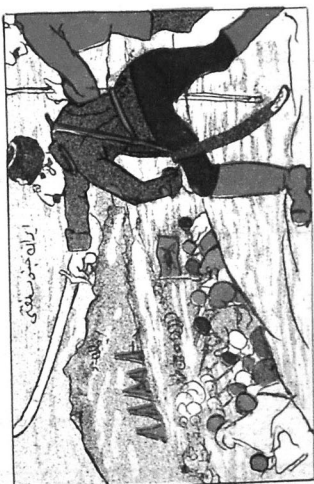
رما خاردا استقلال اجون ليج وردور . Riza-xan as istiklal jolynda kuluc vuyur.

И. Ф. АХУНДОВ даями Азәрбајҹан Республикасы Үмуми Китабына Инк. № 2570