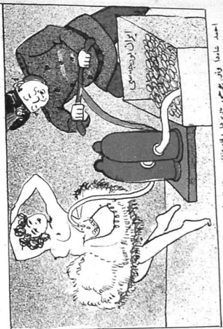
احمد شامدا وان بومسي :پيرودا رامسانك سورعدتا داپيور . Ahmed-shah da var-jokyny Parisda rekkassenin symkasatna dasajur.