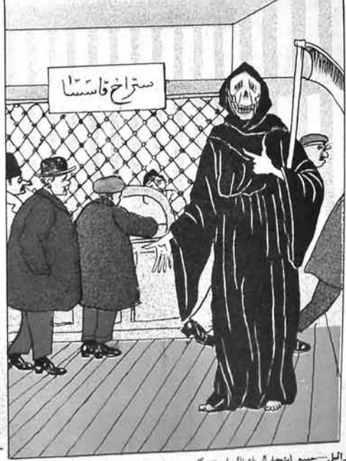
عزرائیل—سجیع اینجیلرک باغینک اوسته گیدوب عفا ویرمن من، اما سعوتنه فاسامندان وقت وقتنده موایب آلان دوکتورلار. Əzra'il—Comi' işçilerin başının üstünə qədib səfa verən mən, amma əgərta kassasından vaktül vaktında mavactı alan doktorlar.

1917 2570 KAZAN QAZAN QAZAN KAZAN QAZAN QAZAN