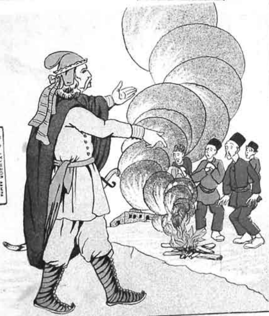
طهمورت—اوغلووم دورا بو اودی من اوندان اوتری پاندریمیشام که خلق آخر جهارعبده اوستیندن آلیسین. من بو اودی بو فاسلسو فاسلسو فاسلسو اوتری پاندریمیشام Tehmyros—Oglym dyrl by ody man ondan etru jandirmamı,şam dl, zolk axır çar senbede usundon atılsın. Man by ody by memunun hokkastından etru jandırmışem.

1917 2570 KAZAN QAZAN QAZAN KAZAN QAZAN QAZAN