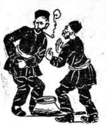
سن تولسن. آندالوسون بو یابرا بما تخته اهکنن شامولایه: هرگاه ایبرام آخشاسی اولماسا ایلی ییمه. ساه ایبار بولارانی آندایا.

کینه لوقی قاسول ای الی تفرقه نی تزلریندن چخاندو نلیجه جان: چونکه هطار همان تزلری کراه ایلیوب هر آدام باسی ایدیا ایکی ساه کرایه و بریرلر بیس الیه لکند. مختصر هطاری گورولور که مسجد بزلرنگ شمیر احتیاجی وار. و الیه که هطار نی تزلری تگورولر چوه. مذکور عضورول تزلرنگ قایوستا قلیل ووروب آچارلاری تانیرتوز قلیل چورمالارایک عبارت اولون سندرکاورگ بورینسی اوج ننه. اتان حاجی اسلامان و اونگ قونسی خنیفه. الیه کسه هطار ایستورلر توز تزلرته داخل اولور. همین فولی چورمالار بازار اهتدن ایکی یوک تک مسجد برست سلمان قارداشلار بونک چایوروب هطاری خورینیه اوج برهنه کورولورلر که آخرد حکمو مت مابورلی گلوب مرکته کیسولر.