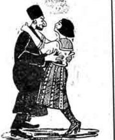
مارويس - شهيدى س نه باره امله آلاچانان ...