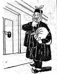
چوق عجب آرواد نومدسفالنگ خاشی بولماسا تویز بیریادی که گتیم خدانه ایشیده کچمش چاراشنده آخشاسی اولدیمی ایچون حمله ییلدیر.

چوق عجب آرواد نومدسفالنگ خاشی بولماسا تویز بیریادی که گتیم خدانه ایشیده کچمش چاراشنده آخشاسی اولدیمی ایچون حمله ییلدیر. چوق عجب آرواد نومدسفالنگ خاشی بولماسا تویز بیریادی که گتیم خدانه ایشیده کچمش چاراشنده آخشاسی اولدیمی ایچون حمله ییلدیر. چوق عجب آرواد نومدسفالنگ خاشی بولماسا تویز بیریادی که گتیم خدانه ایشیده کچمش چاراشنده آخشاسی اولدیمی ایچون حمله ییلدیر. چوق عجب آرواد نومدسفالنگ خاشی بولماسا تویز بیریادی که گتیم خدانه ایشیده کچمش چاراشنده آخشاسی اولدیمی ایچون حمله ییلدیر.