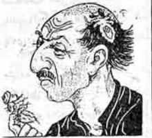
حصال - آئی شیخ آ مین اوریتھہ آزیت واروہ کہ سندہ آدریسراں شیخ جن حفظ الصحہ نقطہ نظرمدن منش قاتلاری سوزورما.

نصرالدین کے دیوب کہ: عرب شریعت گزیرن دیوب کہ دورت کیشن آرتق خامرد. اما توی ایگری آرواد الملشد، حرک شیخ انکار ایگری، بیورسین ادارہ ایگری آرواد آئی، آتسی فیلتی کیسی بہ گوندہ ارہ سینگتیرنی و سودانکر کیشل طرفدن بارشیرلہدین دیوب تاریخ کتلاپی گوزنی یختاق شیخ دیوب کہ: پیسر دول آرواد لاری آرواد کہ تپیری کوجہہ فلما سن