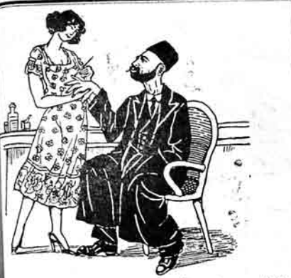
تاملار - شهید! ساع الکنگزه قیزه لارشی تیزلهدیم سول الیکری ووه یگر، مشدی - سول ال متقولدر، تاملار - نیجه شهیدوار، شهیدی - تیزگه مکر استیگر تسج جووریم

په ینه دیووک قارواش، ایشیله نده کیچیک قارداش، ملا علی بن دیوم آله بزیم کیشی ننگ پلاشی، ورسن سن ده دیکن الهی آسین! والله بن قارا کونک شگ دوه دفته بزلفالی دک! آکیشی بو پاشی پاشیش اریواشیمه بر ادروس لژی آسین سن دکله میج تکری گونیه وریم. اوج آت بوزدان فلق لووا دوسته اوروس آردوانک بریما ایله، داما دینا هر نه واراییمه اریواننگ لپیون آندی، جانر، عراق راه ایله داشتریه. توزده اون پیش گون، گون، گونمده بن حق افلامه، عمو دوستی نه دیدی که آملانا ایشی اونک اریوانیمه اریک اونک ایشون شی آلی، اونکه ایرام ایوره، آله لوسا سکنده اریوانکما اریک سگ ایشون آلاز سکنه ایرام ایمن. توروز پارلیله بر هغه قاش کیشی از برت بادام آندی