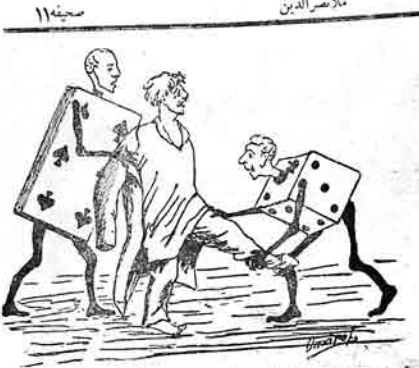
قوعار بازیمه که می قوعار جیلیاق قویوب، الیمه گیتیرلی جیلیاق قوعار حده واردر.

یولور اقا یوسنی حده گوشری اولاندا خلق تیزردن جانی ایچ کیمسه تمیر - آرداد تیزاولوا و اشغ پت لارشی گیتیر! آرداد - اولوب کیشنه تلمیرسن! کیشی - جیوخ داییشما تیز اولدوت کچیر. آرداد - یهک وهی! کیشی - یولور اقا! آرداد - ایشک توکولسون - دیمن سن یولور اجیر، فوی بر ساندن سونگرا اولسون. کیشی - آت مالک لیزی میج پلیرسن ته: کون چیقان کیشی گریوب یولور اقا لای سالب گلوب کیدندن ایکی شاهی آیرلا! آرداد - نهدن اوتری! کیشی - اوندان اوتری که: خلق یگار گوشری کیدوب اولادا تیزر هواده نفس چکیر. آرداد - او یوللاری سن خار افر ایدر ا! کیشی - پورسوز اولاشلازق مستند: آرداد - سایندی سن یله اولاندا ایک شاهی تکی گریوب یولور اقا گیر! کیشی - کچیکلاز، وارایلار. آرداد - سن کبیلار نیجه اولور! کیشی - اولاندا سولوب اولانیدن پاشوت گیتیر یولور اقا پویشنا، گویور لر که یو ییبرلاز دایانجا اریوانیمه، اولاشلاز آت لاری شی دوکوب آخوردن فاشاق استیگر آخرده کیشی بالاری دویلوب دیوره: کوریرسن پولواک لاریسنا خوراندن اوتوروب هر که، خوروت بوتوب سن یید، اوتاق بر گوزلی ایه یولور اقا قاشما کی بوزشی لورشان بوردی ایله سوزنل بریشنا گوروزی ایله هر نانتک پاشینا بیجان پاکو «حشیرت» باعوب دیوره: پایا نه ایشون اولفیدا اوتوران بوزشی بودرا لیور نه ایشون او اشخارلا تیزلار پاشینا قاشما!