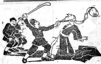
حشعلی - آ آ شیخه بند اولما! گوروزیر که کیلیدر.

تبریزیک امام جمعی حاجی میرزا کریم آغا لیک مسجده در که ایگه سالماق یروخدر. هر گون آغا جماعت نائزنی مریدلر ایله قلوب فوراناسان سوگرا تبریز شهر آزوب و عیبه سولوب، آفتاب انالار دان سوگرا رستورالاردا و جایخانلرد و قوروخانلرد غریبه بر شکله اولور. هرگون دوروشلر حسین کردن و هجره نامه دن نقل دیورلر، حوری و عثمانلارده بیوک حوسایله اولاغ آسیرلار، بر افغانلر دان سوگرا گیدوب یایی سولک فهوم خانمده نورتا ووردی اویشلارنا نشانه ایدریم، خیابانلاردا و بولوارلاردا ایچتیرق جراعلاری یائیر، حویلر و عثمانلارده لریله سنده سولولا و روسلار (ادوجکا)