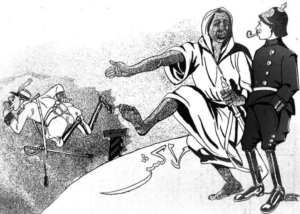
مراکشلی (تسه)۔ حیا سز دشمنی ووردوبچیتاومانق لازمدر. یوتسا نومه ویرمک ایه فرنک (دور) دان چیقماز