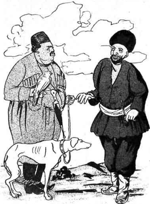
بلک (کنڈلیہ) - بز سیزی اٹھ بولینا دعوت ایفہدیگتر ایچون بزی کوچوردیرلر، ایندی دیرطریسی آباررام نوللریسی سیزه تاپشیریرام.