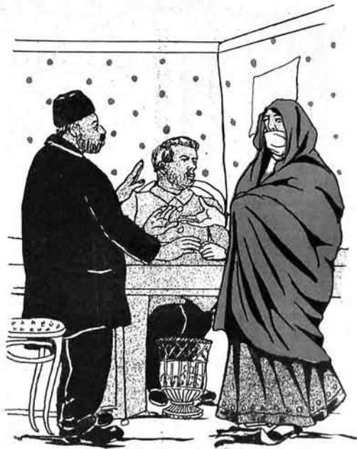
فانین (زافه) - آکشی بو نیجه اینشدرکه من اره گیدیم اما اریسی گوریوم. راقس - ایندی ییلهدر. بزیم کنڈلری ده اوج ییلدر شه فینگه گوزدو ویر هیچ یوزلرینی گورده شنتک.