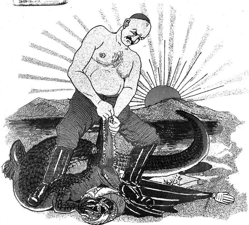
محرملېك موھوماتې شرق باناقلارېنك مدهش بر نساھې (قاراقادېلې)در.

نومرو ۳۱. قیمت ساتیبی النده ۲۰ قېك MOLLA - NƏSRƏDDIN