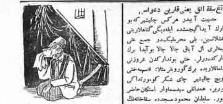
مکتب آچیلماقدیر فویا فنسنگ علی خالی مکتبند او خویان برچوخ اوشاخارک اشتعالاری فزاندی. چونکه معهود آخوند زاده خراسان زیارت گیمشده، فووت ده مشهدی معهود خراساندان فایمور گامدی. بیونن مکتب اوشاخاری و هنده گامگیدر. مشهدی خراساندان کوردکی سوققلاری پایبناخادر. اوشاخارا ایچون مهر تسبیح و ریشیز کوشلایره ایچون مشدر.

دیوردریکه: پاجی نذر جایی وارد کلگرت ایچگرک سی اویادی مسجدلره آدام آز اولندا مالک اویوخا موسی اولمیری دی مسجدک چاپ آخوندا، بر فقیر قزاق میانی آغلاخان اذن ویر ایشدر. الهه آخونلار مریضان راستی اولسون، حتی بر تپچه حیاط سویورن زدهل ساتان اریایلار یوزنه باجیق یاغدیبنی ایچون پولدا اولدر. هر پولدور لریگه بر کسی آریرسین. معانی آغلاخانلار مکتب آچیلمی من ابام حنیف عاجز نوکر تریندن ملا حاجی بیونن خانملارا خبر ویریم مکتبیزی گنده آچوب تشبه دیرنه باشلاخام بیخه حاکم مشایبه حرسه همونی مرتبه مجلسی ایلمشدیم. اأم حسنگ دونکن همعلی خانملارا سبزیندن چارواکان باشلامش توفی توام کوریک چارقاق قدر خورنت که برات ایلمشده قیقام. نازا منته اولدمیک کینی ایچون قویتقادا در کان مائده بر ذوقکمتم کس همان شیرایه ستم. سائین، درس آخونکایلی اولان خانملار یوانا سبار. برهنی قافی بوکچوستگ م نومروی دالاندا ملا حاجی