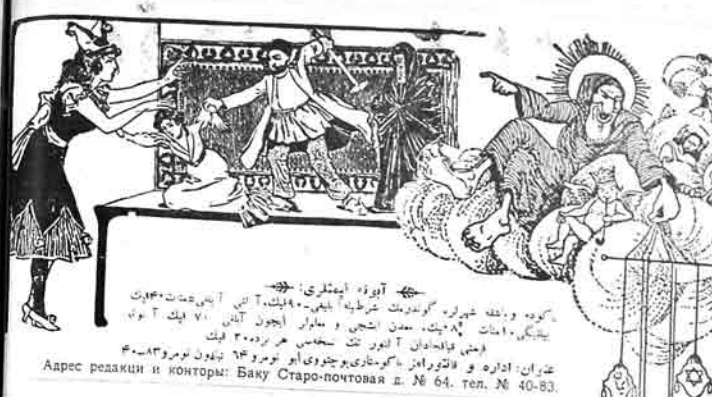
با كومه و باصفه خیربره گورنومك طرفیله بیله... شهران: اداره و فائزومین حکومتاری بوختوری ابو نور محمد ۳۴ ندوم نومبر ۱۳۴۳-۴۰ Адрес редакции и конторы: Баку Старо-почтовая ст. № 64, тел. № 40-83.