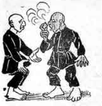
مشهدی نصیر — آما حسن! بو پاجیقدان بیس نفوت خوشی گفیر حسن — یوز دهه مدینه که طوبه خایطندن پاجیق گوروم ایازار کابوب «اورتوب» اوستینی با من اولار

تقوم نجم الدوله کلیه اوضاع کوچک و بزرگ مداین سال دلا نت وارد بر توقف و خوش گذرانی اطمینت احمد شاه درفته و غیره و متصرف شدن ایران از کثرت خرج وی در دولت و شایسته و زاهدی حزن اندوه ابرس لکن منزلت بفرمان از مغارت شجاع الملک و حاجی معبد آقا حریری و حاجی یوسف قزوینی و بلکه حاجی میرزا ابوالحسن انگیلی و تیره کوهدان و از سلطنت قبول نمودن در آرزوی تقاضای و شتر کشتیدن و مفت بران یعنی ششمان از خرید فروش شش شمال. ورود حسد آقا حریری از اسلامبول و بتزیم و توسیع پدرش در حق وی (بدرالشورای طهران وکیل انتصاب نماید) که من بر شهادت من مولا میرزا محمد مولده و وقف حال حاجی فیذا حید ملاه رش بین خانه از تقاض عاید می شدی انگلی و شیوع مکر و حمله او در گرفتن رشوت و منفوق شدن اهتاه ان گویا در عدله تبریز و تهدیدات او در صفحات ارتق؛ اندلیه آزادی خواهان را نام بالشمکی و حتم مراد حسای حقی سلطان و امیر آوقاف با معض طاه ورود چند خر عریای دزد و حسی به تبریز برای سبزه دانه مخرج یا دعوت برای سفیان بیخه دودویی یا مواجب معلوم و سبزه دانی آفاق باسان عربی و تقاضای روحانیون از حکومت با شمه فزای ملها برای روضه خوانی و مستی و نفوس حاجی ملا ساقط و زاین را از آواز بدستجه خوش و رعیت ملایان تبریز در خوانستن محله ملا غزالی و اشتراک لکریان در شیه گردانی، سیاه بندی سر نیزه های عساکر دینگریز، آله اطم. شاهوش مستعد شده شاهوش مستعدین یو بیان گیکه آخوند ایهلسه جنان یعنی دادشده ایچون ساجعت مشبه اولوب مسجد یکومر مستدر.