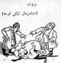
۱ - اشق بوغوروت ییلری تاملان ایسخت

کمال اجرام الله شمه منبری عوشی؛ علی اکبرخان هبت تحویره