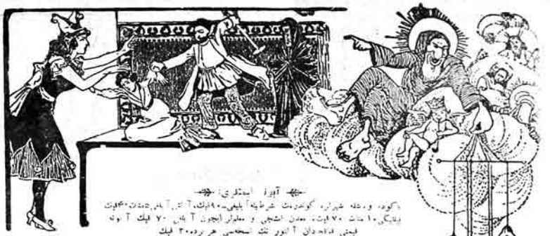
گورو، ودھہ غرارہ، گورویت غریبہ علیہ۔ ۱۹۰۷ء تک آج تک ۱۰۰۰ جوتہ ۴۰۰۰ پونے ۱۰۰۰ جوتہ ۷۰۰ پونے، مدینہ اشجیہ و مظاہر انجمن آج تک ۷۰۰ فیک آویہ یعنی ۱۰۰۰۰۰ دان آویہ تک سمجھی ہر پردہ ۳۰۰۰ فیک غرارہ اشرہ و فائز و مومن گورو تباری و بیٹو و بیٹو اور ۱۰۰۰۰ فیک آویہ ۳۰۰۰۰۰۰