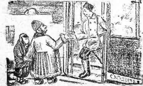
بن هی هیست زواری سزا سوچی قارداش، آروادی بی هیبت آباریرام. نه وریم ییز عن باشقا هیچ کیشی بلیهر بویب آ. قانی تیزی آریسان. آروادنا حرله بیرده مواتور ایباریمز.

عقصر - شو گریزکنده خابز، چونکه بو یوم سندنبر. شو میستی یوفودان اوانیادنا تونزیسی عفریلیم، چونکه چونس سالماتش ایشینی گورده ییسه ایلمه. ناهو کیشی یوفودان ایلازادی، نهده ایمدی بن محکمه ایبرایتمن.