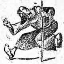
پهلول آي ملامعو، غاراييله فاجيرنما؟ ير دايان بنده گلوب سته چاينم