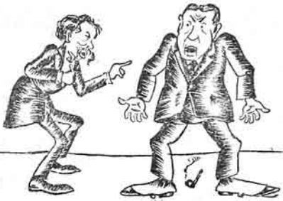
بالوئین - آخر سونگ نه به ماقدوالد - سوزيم اودر که بويه بايرام بوتون سملکنده تعطيل آستين برستن مردمن