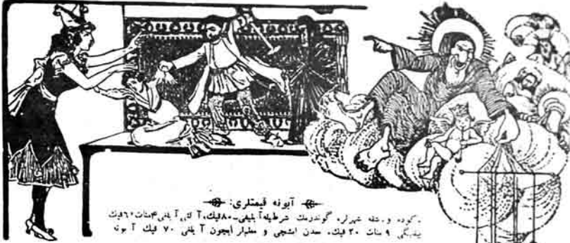
گورده . و خه خيرره گوردمک شرطه آييه . ۸۰۰ ليک آتاي . ۳۰۰۰۰ ليک آتاي . ۶۰۰ ليک آتاي . ۲۰ ليک . سن اشجي و شيلر ايجون آتاي ۷۰ ليک آتاي