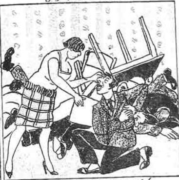
(۳) قوشونى بىنهى پيم بارامى باغلاماغا باشلايدىلار