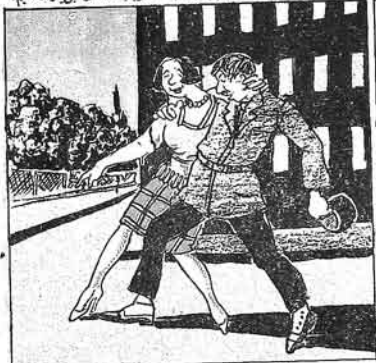
(۳) سوگرا دشمن بزي شاهه اسپر اباردى