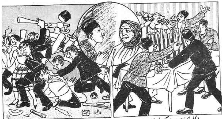
(۱) خزانة پينتوب مشكروى دولدر دوق