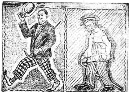
بو قوبورچی آیدا ۱۰۰ سات مەش آتیر بویە آیدا ۷۰ سات آتیر بیجە اویرکە آز آلان چوق باشی آلمان گەئیر.