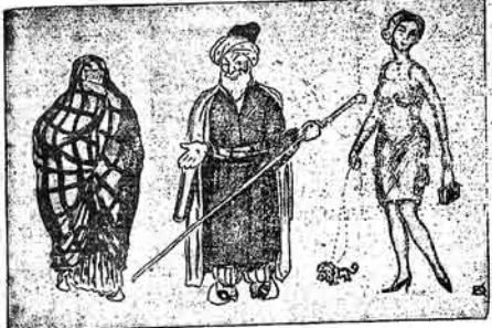
ننه این شوری شوری نه این یی نکی

ییری ابات دلالدر، ییری سنیک، ییری فودوق ییری آت، ییری قویون، ییری اینکه، ییری تویوق ییری کوره، ییری کچل، ییری چولاق، ییری بولوق آداسنا، بولارک قیرمزی ستالارایا بق برایتده گزیشن بانولی دلاللارایا بق