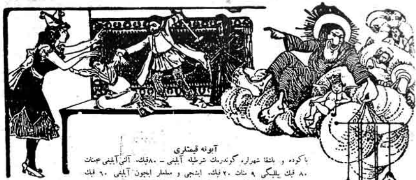
آیونه قیستری با کوده و بانقا شهراره، گوندرهک شرطله آیینی - ۸۰ قنک، آئی آیینی صسات ۸۰ قنک یلیگی ۹۰ سنک، ۲۰ قنک، اینچی و مسلمل ایچون آیینی ۹۰ قنک Адрес: Баяу, Старо-Почтовая 64, тел. № 40-83.