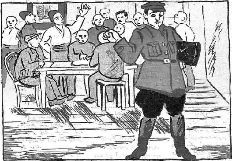
مسئول ایشی - بورادان دوز عملی یاعلی گیکج که بونلارک قلمنه دویمیهک.