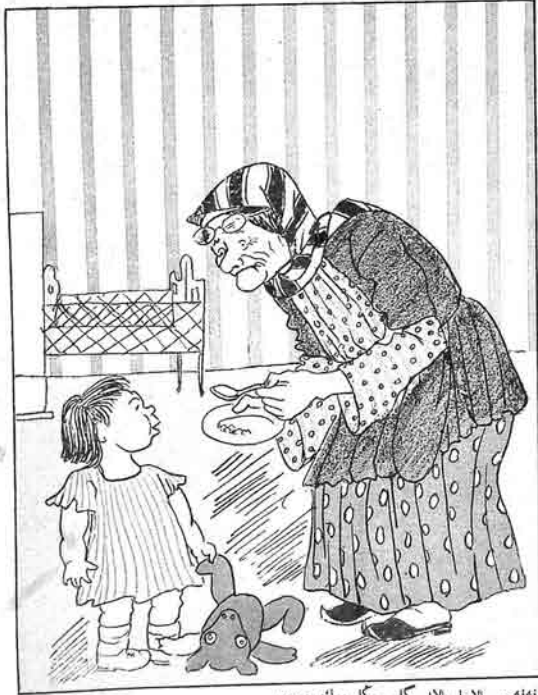
نهله بالاجا بالا گل سکا ییک ویریم

نورس- یوق نه، من ییک زاد ایشیریم کیدیریم قومومولا، بیروشم بار.