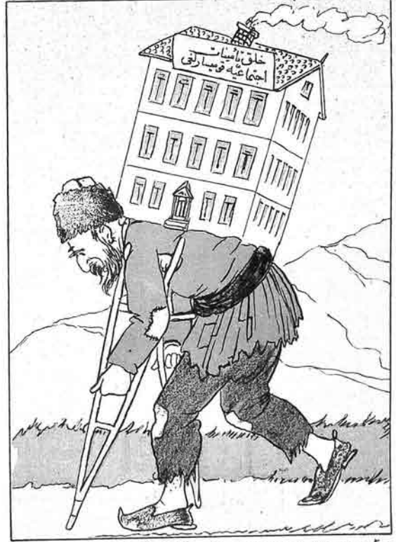
علیل سسگا ویراین بویک فوروشدان اوتزی. کاش بویکهلیکده ادارنی بیتم یلیشه یو کلمهیه ایدیر.

III— Mono verilon by kapeq kyryadan stru, qsa by juqaliqda idarani banim belimo juqlonuşa idilor.