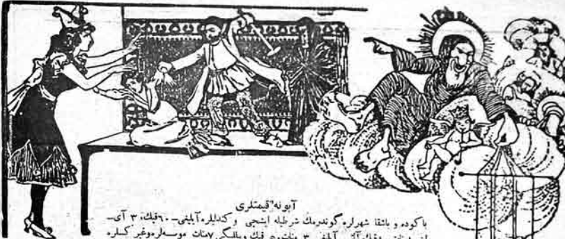
آيونه قيمتلى باكوده باشقا شهرلر گونديرك نرطه ايشي وكدليلر آيئى. - ۹۶، ۳ آي - لنى امانت ۸۶، ۳ آي ايشي ۳ نمان ۵۰ قك ويلىكي ۷ نمان موسلمر و غير كلره اسكى قيت ايلدر. Адрес: Баку, Старо-Почтова 64, тел. № 40-83.