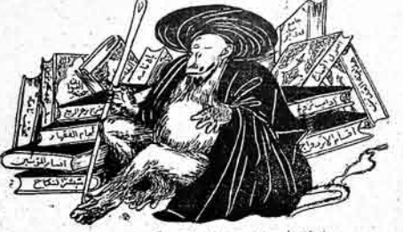
بو یاقتلاردا عتیبات عالیقدان پاکویه گشتش عالیقدرن بری (تصفیایان کون توروده)

سالیان شهرتیده یگی آچلمش «قانتیوه قونوبورانیفده منشریلر اویور ایمن زمان قونوبورانیفک قریزنی دوداق قاترشقا خانته ویریان بولارک آرتیق اولاراق قابیلاراجاق بریقکمن دورت