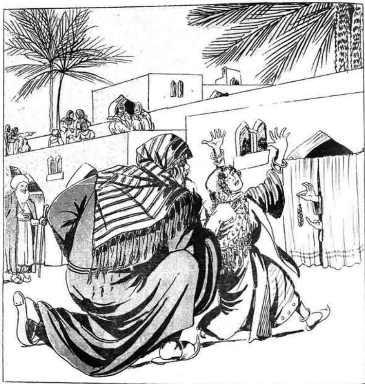
ابوبکر قیزی عابدنی اده ورور.

نومر ۴۸ قیمی سبیر ایله ۱۵ بک MOLLA-NƏSRƏDDIN 15 kapiq Kijmatl № 48