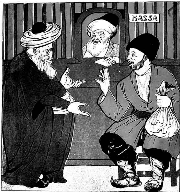
علا - بالام! ایندیکه باختی بون اودوشک، دی کتیر خمس و زکاتی ویرد! کندلی - آخرید! حرام بولدان خمس، زکات آلمان سگه مصلحت ده کیل