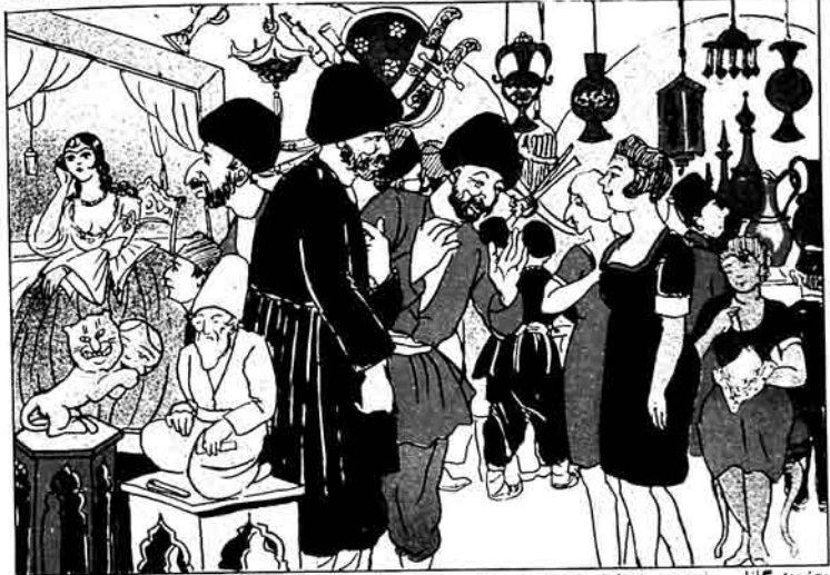
موزده مگنلر - (خدنجهی فیزلارا) والله، اصاب دنک باریسدر، چوق قشک خدمتچیلر سگوز آجاتق بیر آزدا ییزی بانا سالیف دعا قشک اولاردیگر.

ایستهم موزده مکره نیشا ایچیلد، ایستهم موزده دن استقلاده ایچیلد!