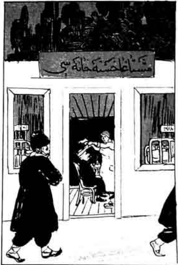
کوزنک هانکی خسته خانه ک مشریمی چوقدر!