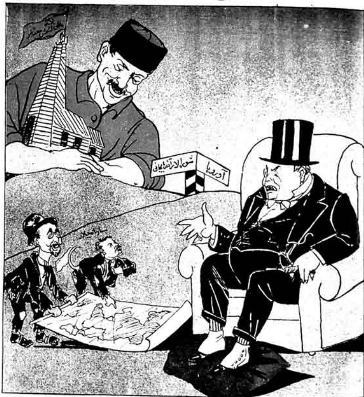
قىزىل آذربايجان ايشچىسى - لوى بايىلاردا ساتلىق دەگىل!

فرانسادا ساراھچىلار، ۶۴ تحت معترضى ساتىرلار.