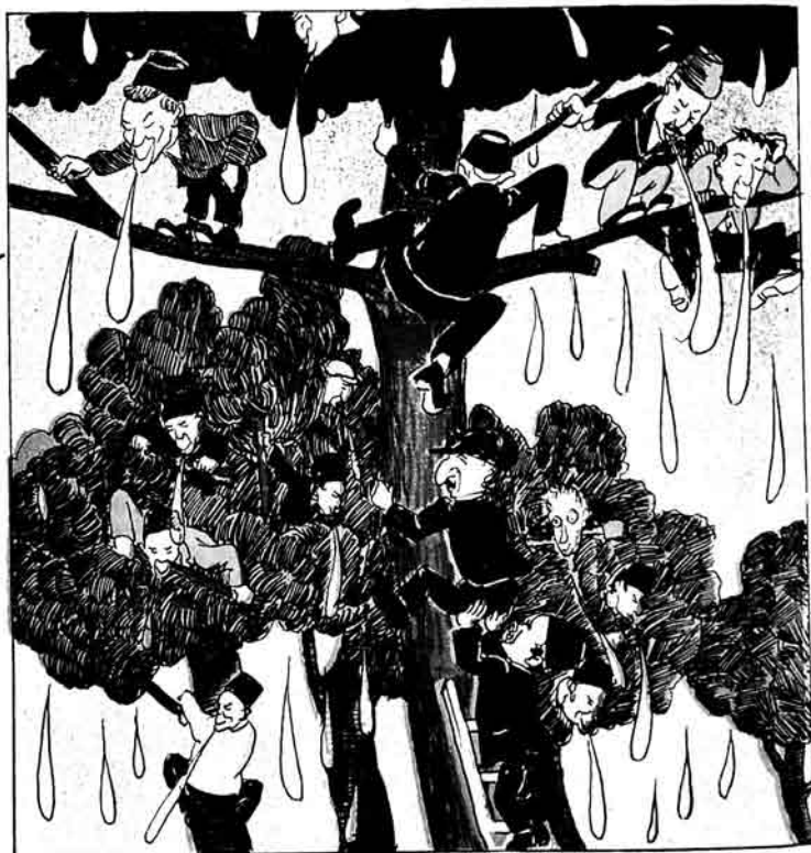
— اوپله كه بو كهك آغاجك باشنا چيقله، اوردان بوتون آناغيدا كيلارا توبوره يله ريك. — درو قاتلىق