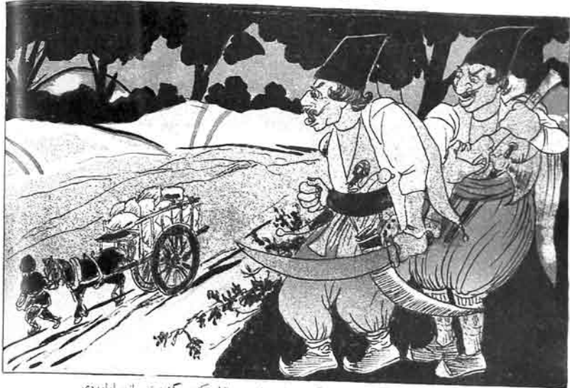
کیچمشده - فولدور طرلان بوللاری کسوب غارت ایدوب مالک کده کینهته مانع اولوردی