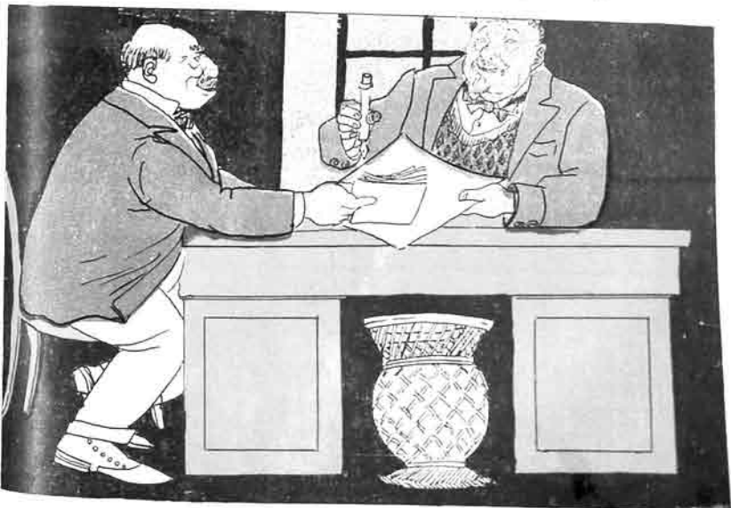
ایندی - فولدور طرلان - طرلانوف اولوب، کده گیدیش ماللاری احتکار ایدوب، طرلانوف بوللاری